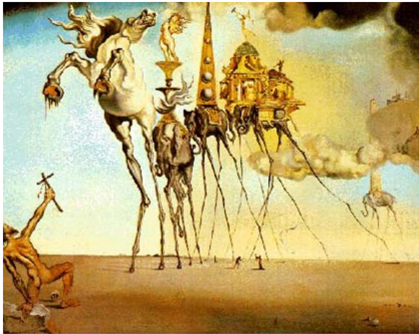
A tentação de Santo António - Salvador Dalí Reais Museus de Bruxelas - (XX)

El Surrealismo fue creado por André Breton por medio de la publicación en 1924 el Primer Manifiesto surrealista . Breton unirá la provocación dadaísta con las ideas de Karl Marx y Sigmund Freud.. La gran enemiga será la Razón represora de los impulsos naturales. Los surrealistas propondrán el uso de técnicas expresivas, como la escritura automática, para romper el control de la Razón. Otras técnicas fueron: la escritura bajo la influencia de drogas, el collage de esloganes y frases recortadas al azar de periódicos y revistas etc... Lo que pretendían era el despertar en los lectores sentimientos y reacciones inconscientes.