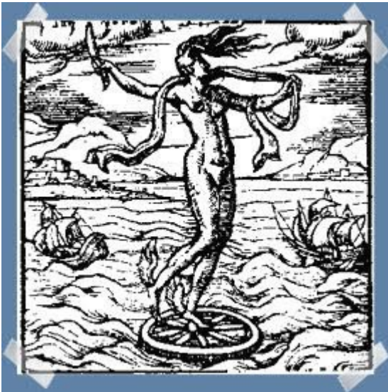
Diosa Ocasión

Seguro que has oído alguna vez esta expresión. Si es así, a lo mejor te has preguntado qué significa.