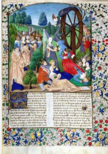
Diosa de la Fortuna y su rueda

Uno de los temas que más va a interesar a los escritores del siglo XV es la Fortuna, prueba de ellos son los numerosos libros que abordan el tema: Diálogo de Bías contra Fortuna del Marqués de Santillana, Laberinto de Fortuna de Juan de Mena, Compendio de la Fortuna de Fray Martín Alonso de Córdoba, además de las numerosas alusiones que aparecen en La Celestina o en las Coplas a la muerte de su padre de Jorge Manrique. Es lógico que les preocupe este tema a en una época de intensos vaivenes políticos, sociales y económicos, donde parece que nada es estable.