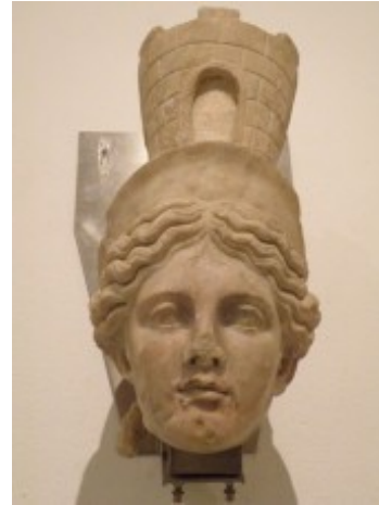
[Créditos de las imágenes: izda. Rueda de la Fortuna con Jesucristo entronizado en el día del Juicio (fotolog. miarroba.es; centro. Diosa Fortuna (convistasalmundotic.com); dcha. Diosa Fortuna