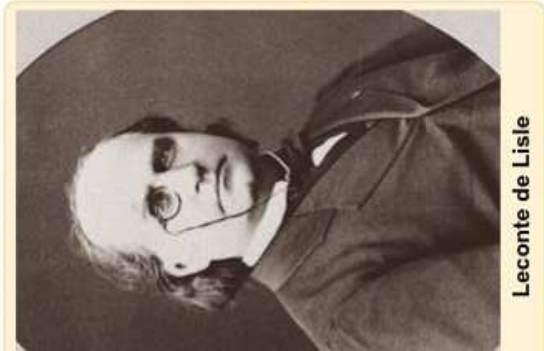
Leconte de Lisle